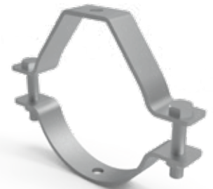
TABLA DE PRODUCTO