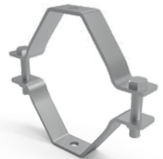
TABLA DE PRODUCTO