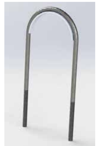
TABLA DE PRODUCTO